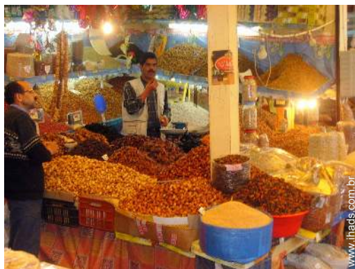
Atracções e lazer