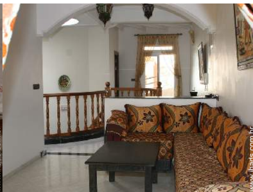
Atracções e lazer