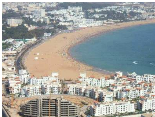
vista centro da cidade