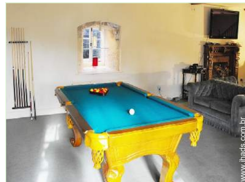
salão de jogos