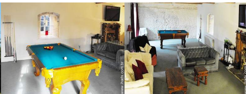
salão de jogos