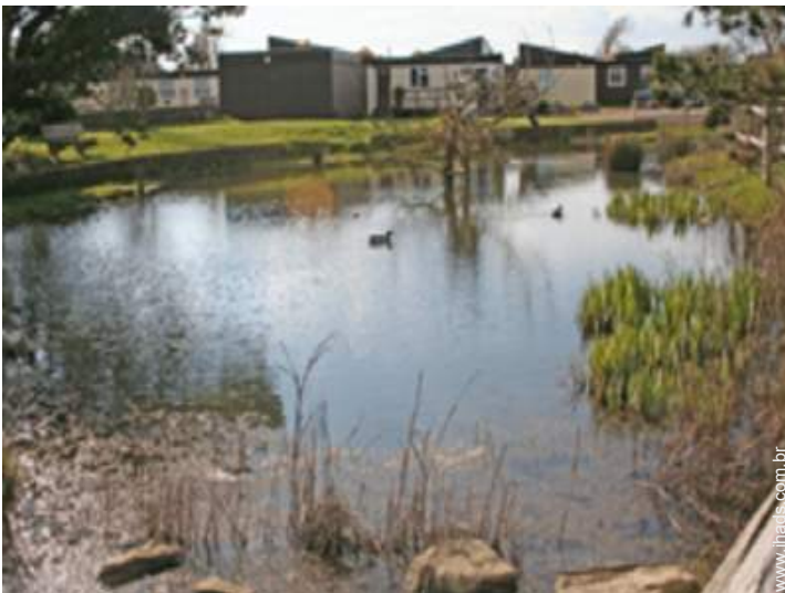
vista de campo