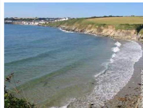
atividades balneares nas proximidades