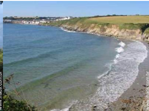
atividades balneares nas proximidades