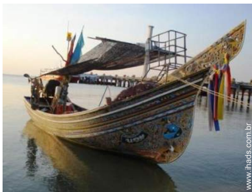
excursão de barco