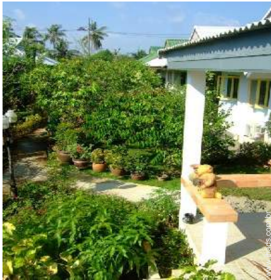
vista de pátio