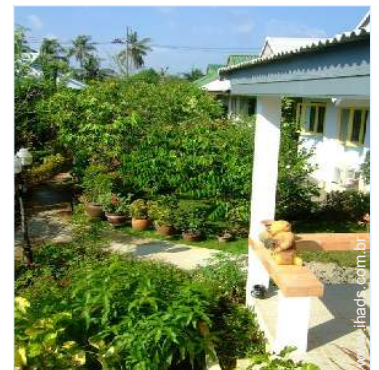
vista de pátio