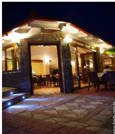
Instalações exteriores à disposição dos hóspedes