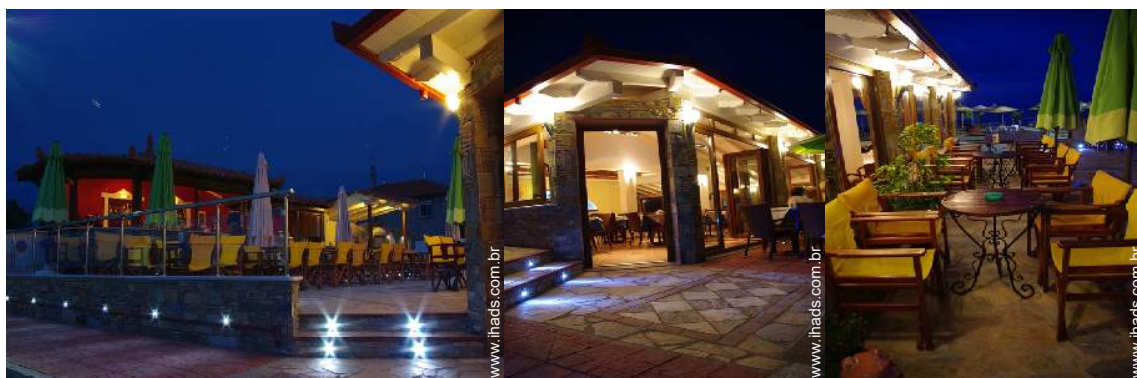
Instalações exteriores à disposição dos hóspedes e infraestruturas de lazer