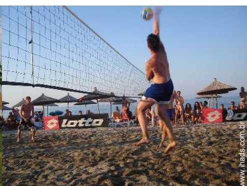
campo de vôlei