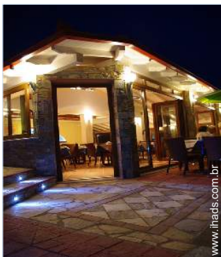
Instalações exteriores à disposição dos hóspedes