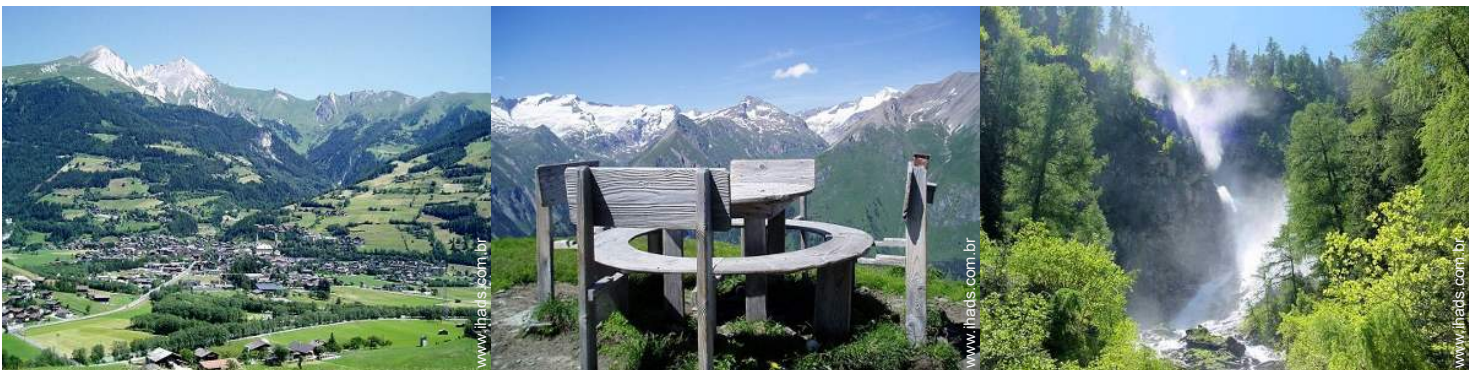
vista centro aldeia