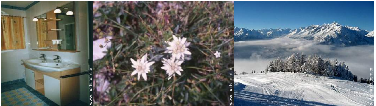
pistas de esqui