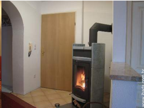
fogão de lenha sueco