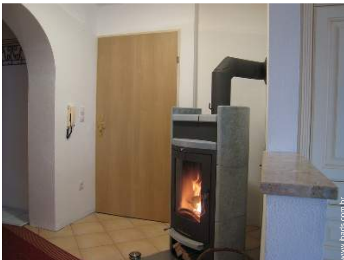
fogão de lenha sueco