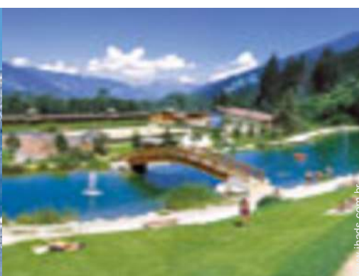
actividades balneares nas proximidades