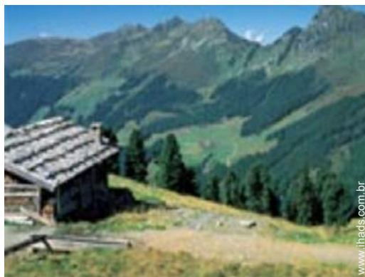
actividades de montanha nas proximidades