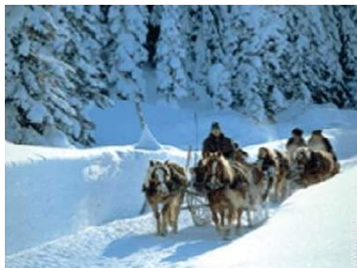
passeio de caleche