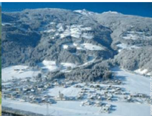
actividades de inverno nas proximidades