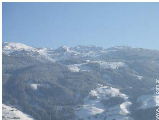
vista de serra