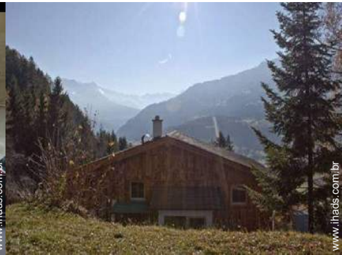
vista de serra