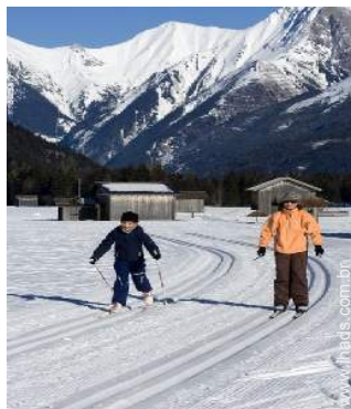
esqui de fundo