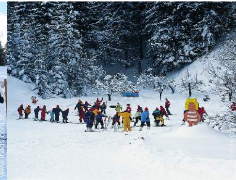
clube de esqui para criança