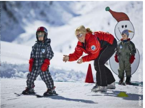
clube de esqui para criança