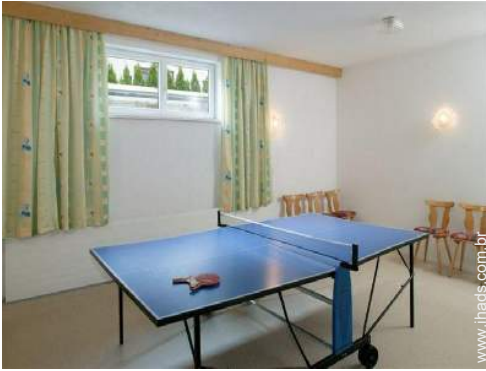
mesa de ping-pong