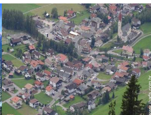
vista centro aldeia