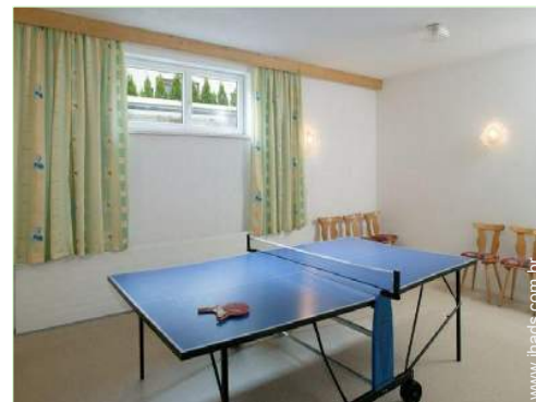
mesa de ping-pong