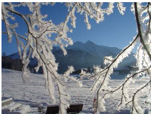
vista de serra