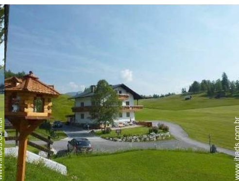
Moradia de Luxo