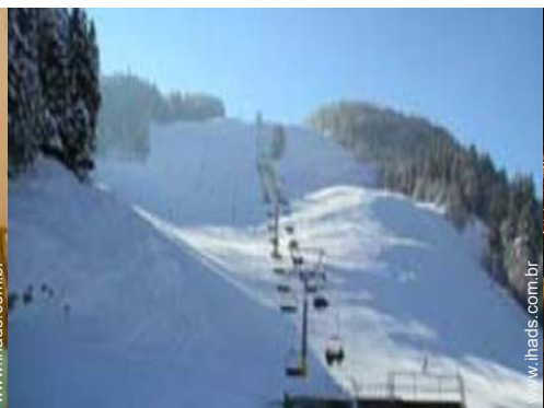
actividades de inverno nas proximidades