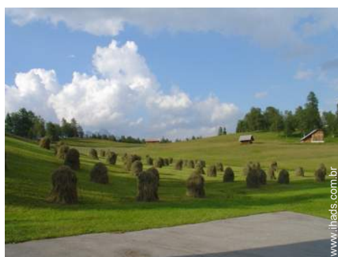
vista para pradaria