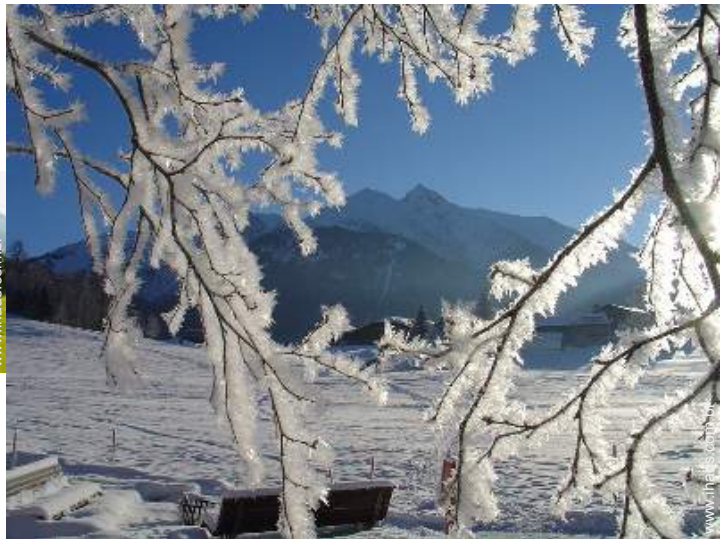
vista de serra