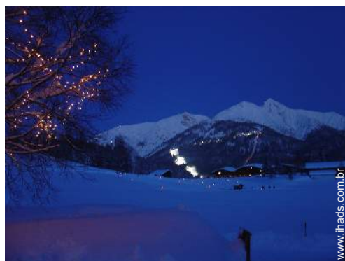
vista de serra