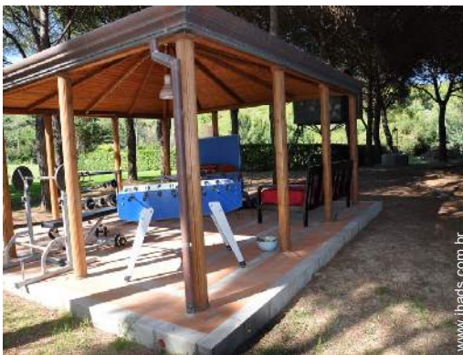
sala de desporto