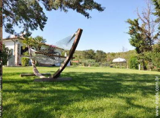
cama de rede