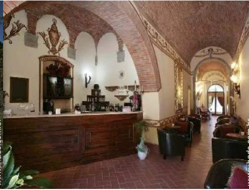
vista a partir da casa