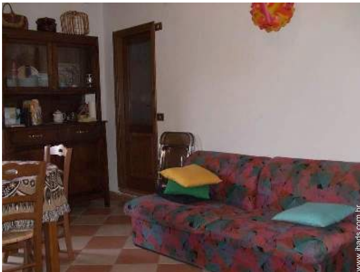
sofá(s) cama 2 pessoas