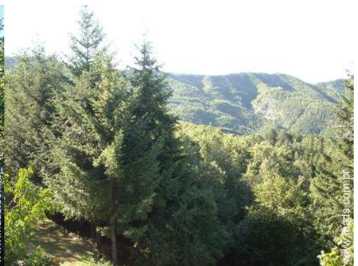
vista a partir do apartamento