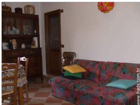
sofá(s) cama 2 pessoas