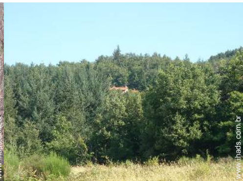
vista da propriedade