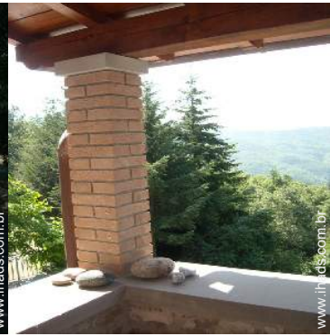
vista a partir do terraço