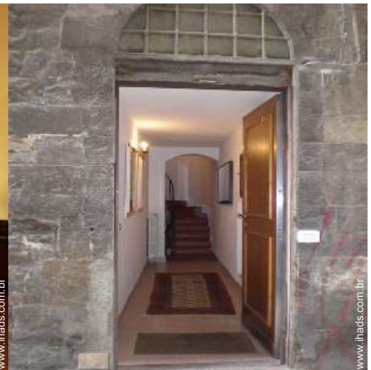
vista rua para peões