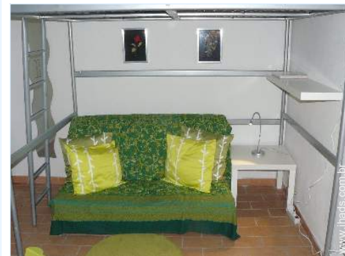
sofá(s) cama 2 pessoas