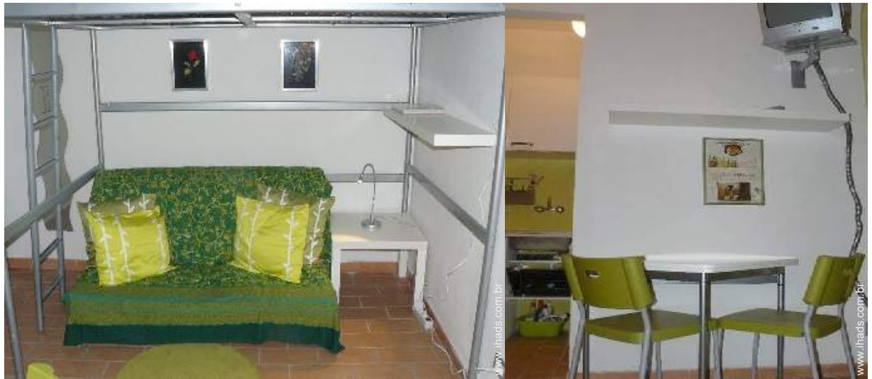
sofá(s) cama 2 pessoas