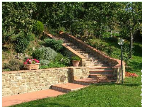
Ambiente exterior à disposição dos hóspedes