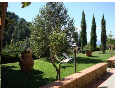
Ambiente exterior à disposição dos hóspedes