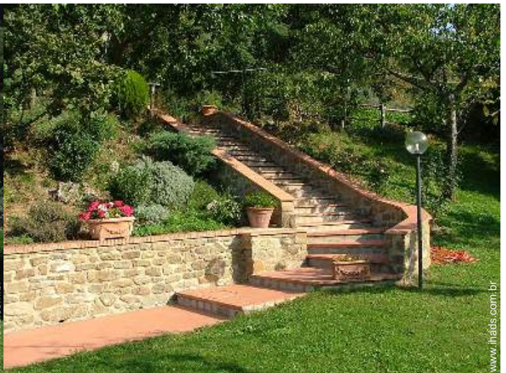
Ambiente exterior à disposição dos hóspedes