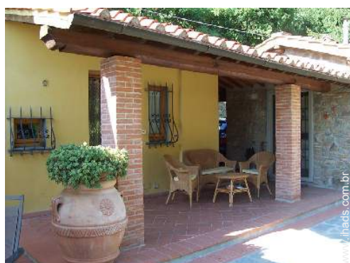
Equipamentos exteriores à disposição dos hóspedes