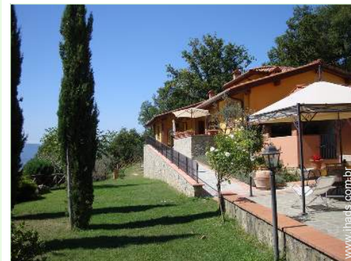
Acolhimento das pessoas com deficiência