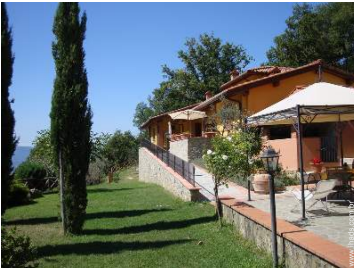
Acolhimento das pessoas com deficiência