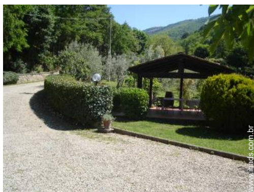
Instalações exteriores à disposição dos hóspedes