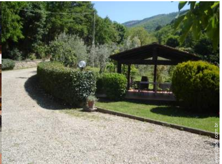
Instalações exteriores à disposição dos hóspedes