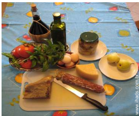
caves e provas de vinho