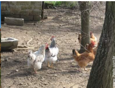
animais da quinta