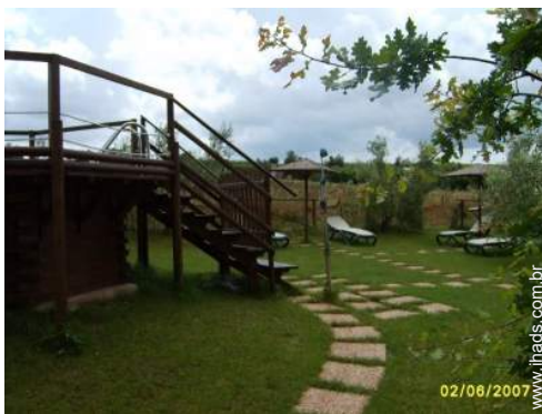
lago de jardim