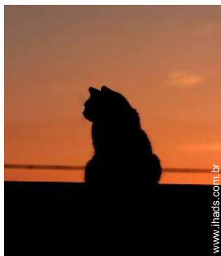
Os animais da casa