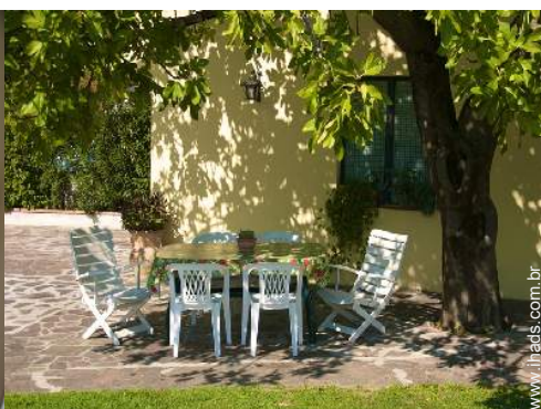
mesa(s) de jardim