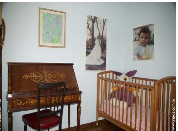
cama(s) de bebé