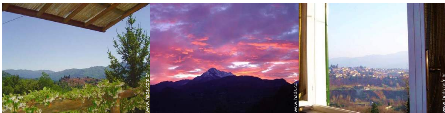
vista a partir da varanda