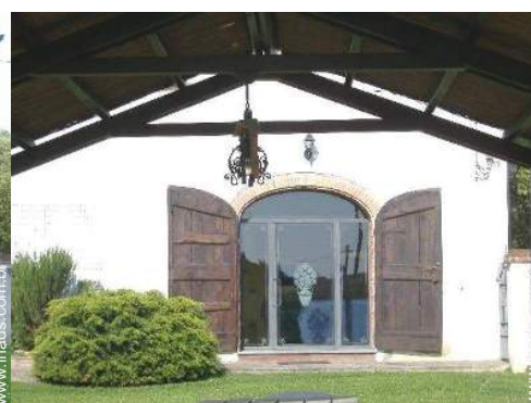
Ambiente exterior à disposição dos hóspedes