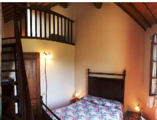
Divisões interiores à disposição dos hóspedes