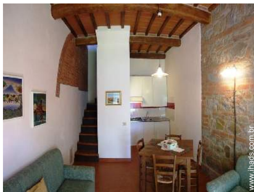
Divisões interiores à disposição dos hóspedes