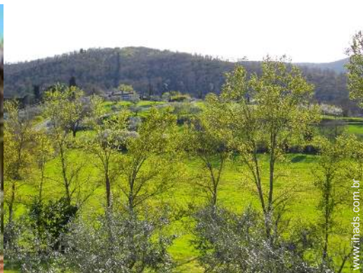
vista de campo