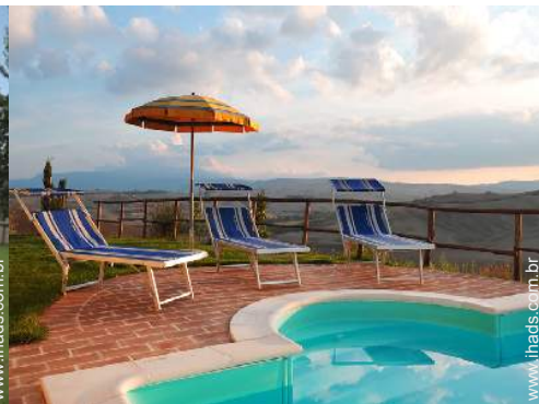
vista sobre piscina