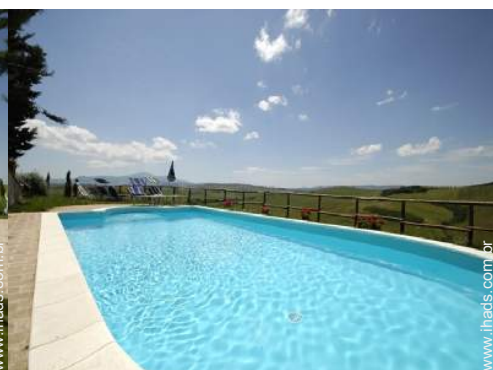
vista sobre piscina