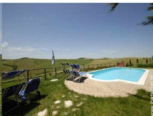
vista sobre piscina