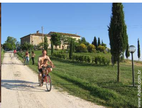
visão de conjunto