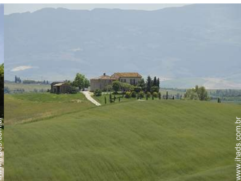
vista para campos agrícolas