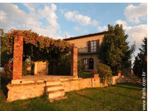
Ambiente exterior à disposição dos hóspedes