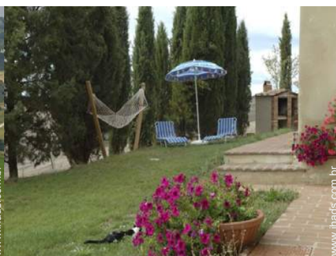
cama de rede