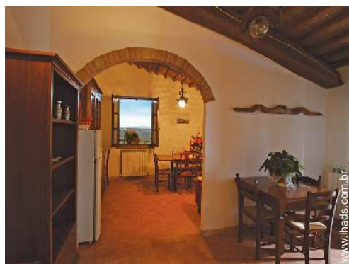
vista a partir do salão