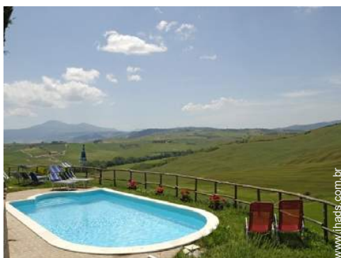
vista sobre piscina