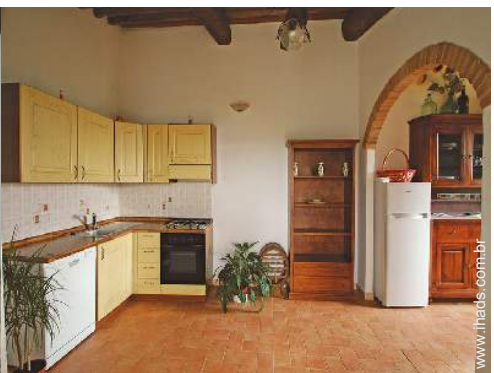
vista a partir da sala de jantar