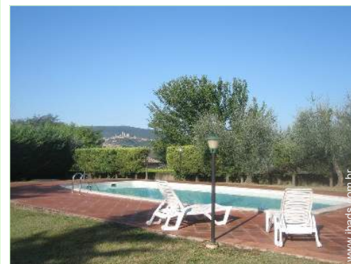
Piscina de água salgada