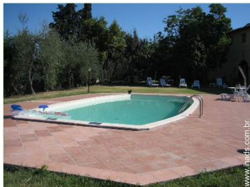
Piscina de água salgada