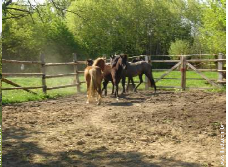
centro de equitação