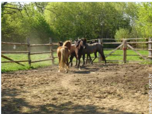
centro de equitação