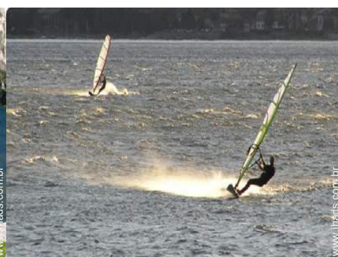
prancha à vela