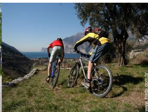
BTT (itinerário circuito)