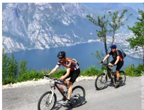
BTT (itinerário circuito)