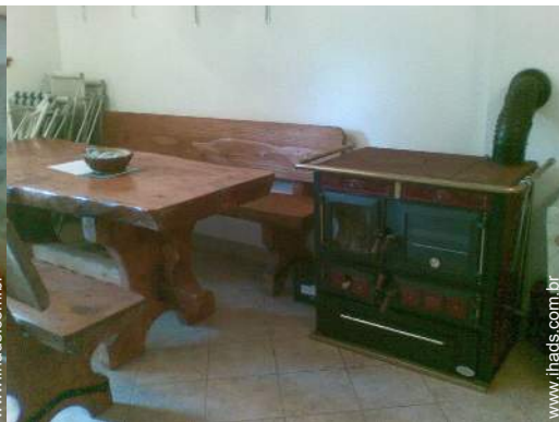
fogão a lenha