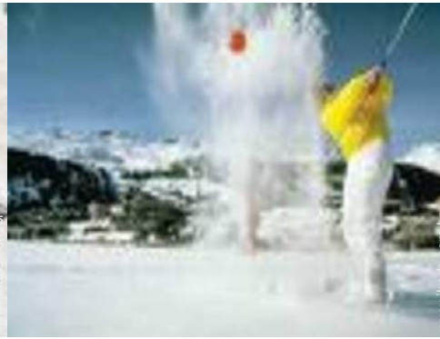
actividades de inverno nas proximidades