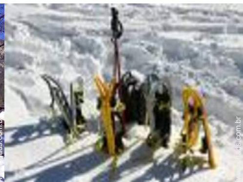
passeio de esqui