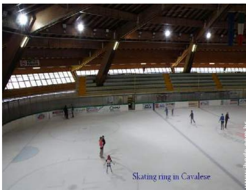
Skating ring in Cavalese