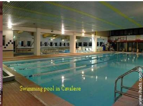
Swimming pool in Cavalese