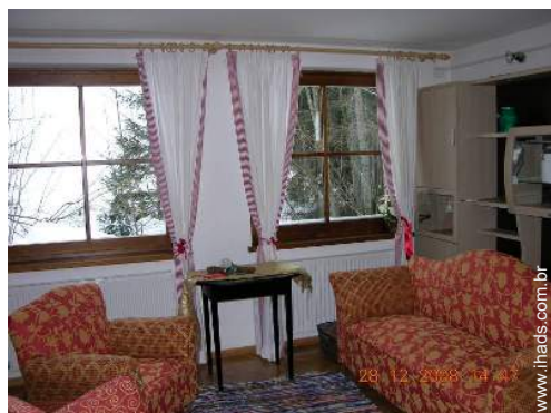
vista a partir do apartamento