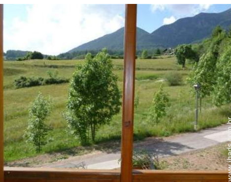
vista a partir do apartamento