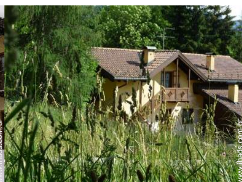
Aldeamento de qualidade