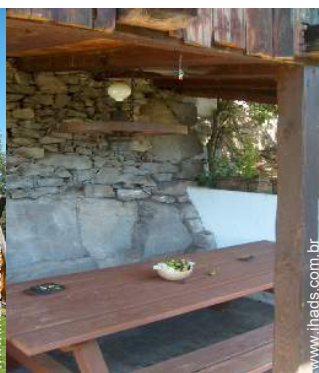
mesa(s) de jardim