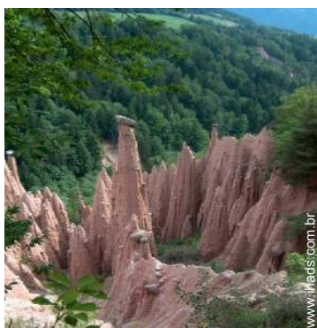
Atrações e lazer