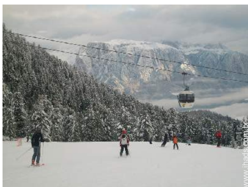
pistas de esqui