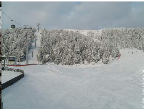
pistas de esqui