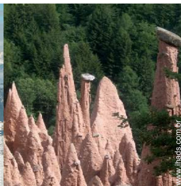
Atrações e lazer