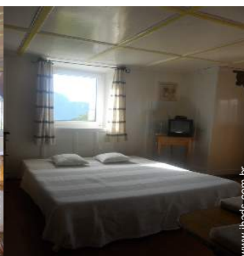
sofá(s) cama 2 pessoas