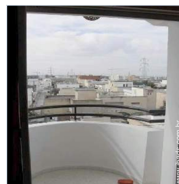
vista a partir do varandim