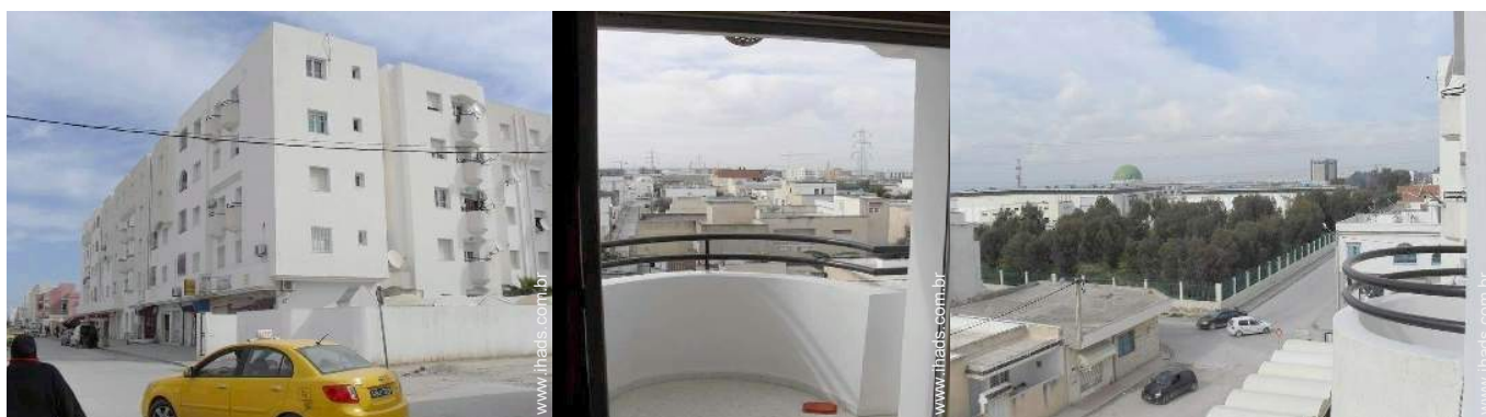
vista a partir do varandim