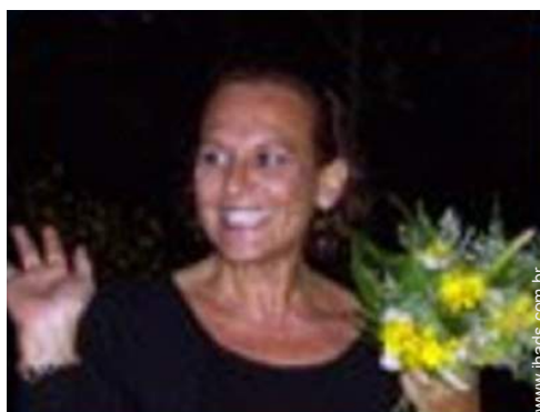
O seu hóspede