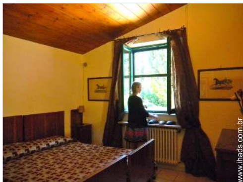
camas separadas simples