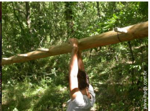
atividades de verão nas proximidades