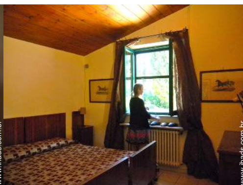
camas separadas simples