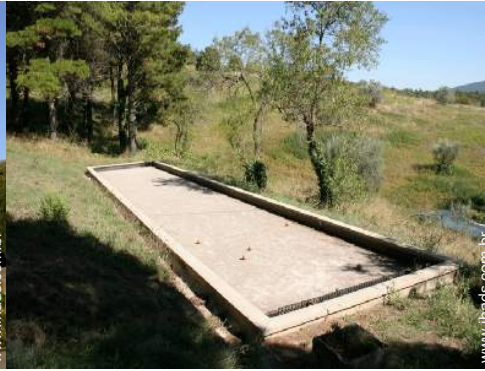
terreno de petanca