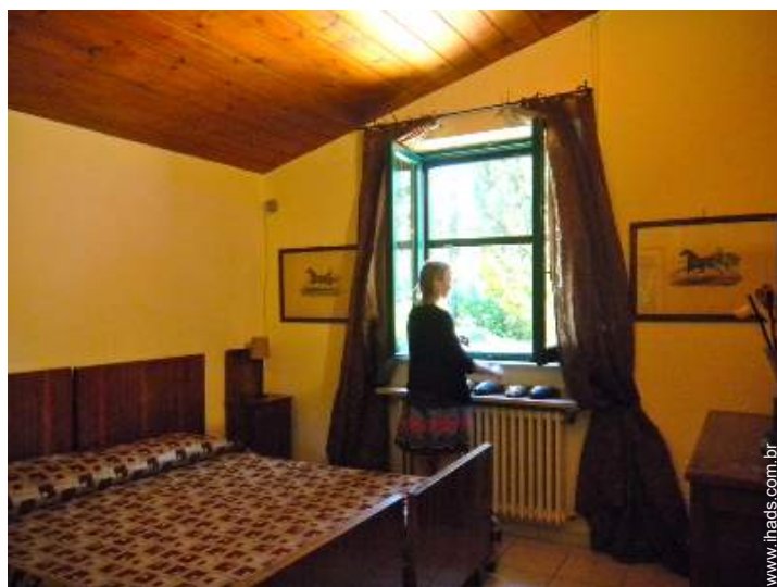
camas separadas simples