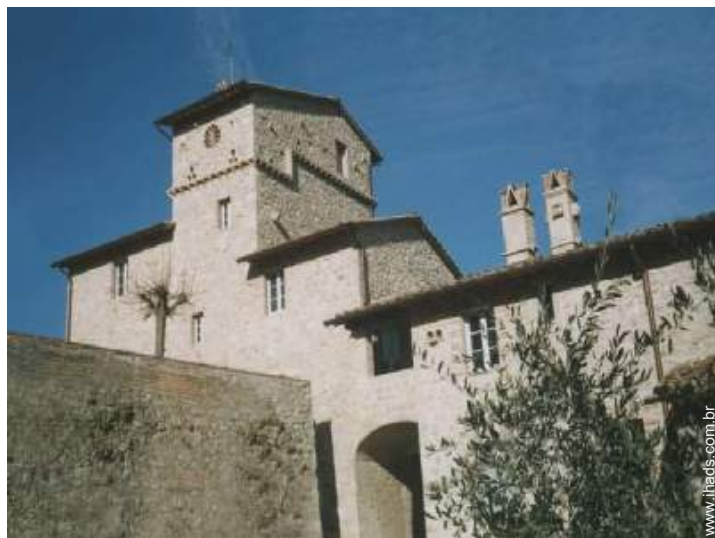
Mas de Encanto