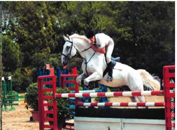
passagem a cavalo