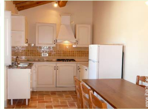
fogão a gás

Barbecue, mesa(s) de jardim, cadeira(s) de jardim, guarda-sol, cadeira(s) de praia, balancela, baloiço, duche exterior, WC exterior