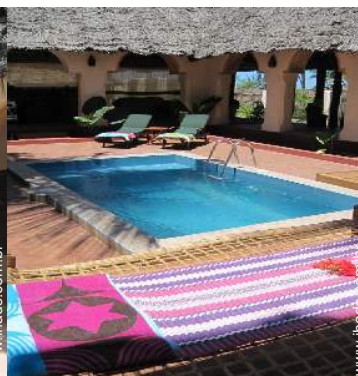
Vivenda de Luxo