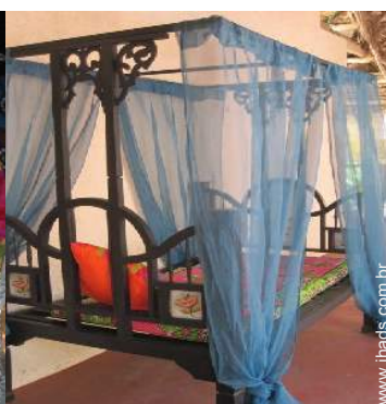
Vivenda de Luxo