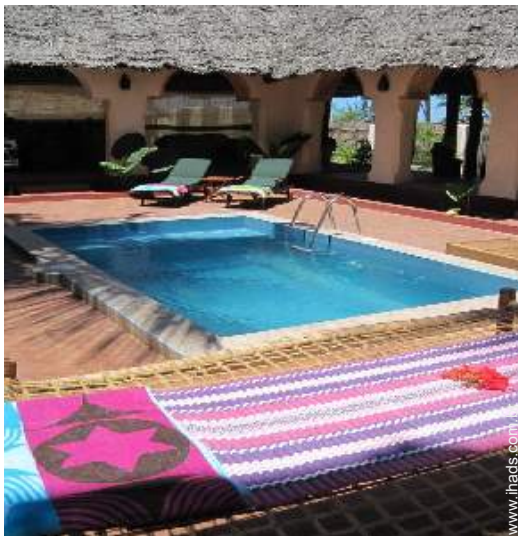
Vivenda de Luxo