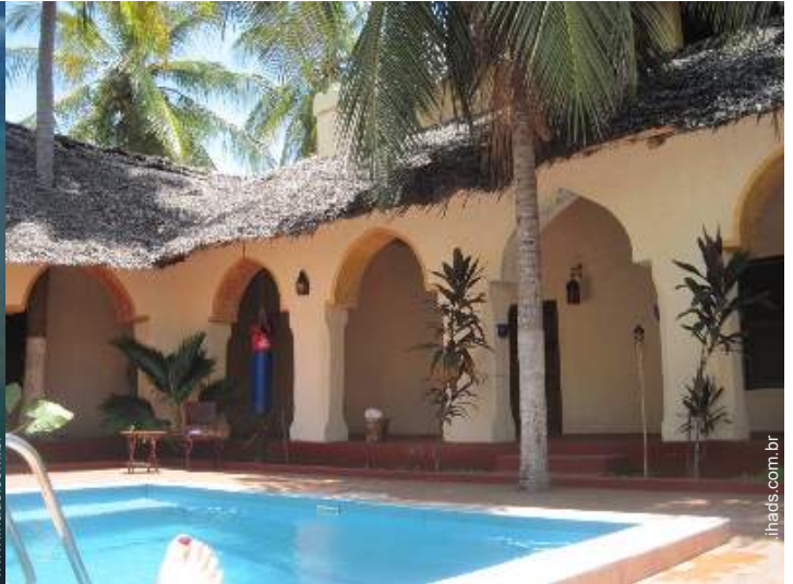
Aldeamento de qualidade