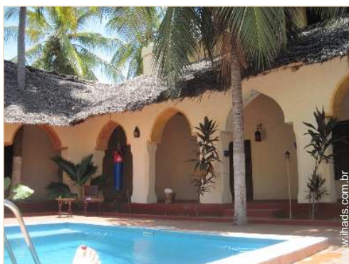
Aldeamento de qualidade