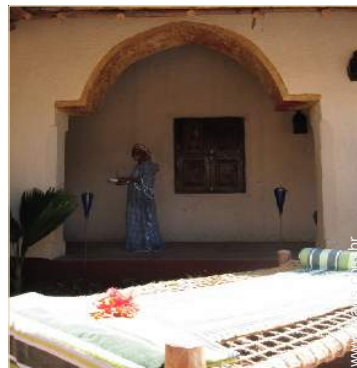
Aldeamento de qualidade