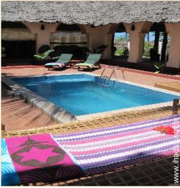
Vivenda de Luxo