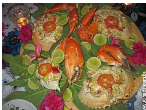
preparação refeição local