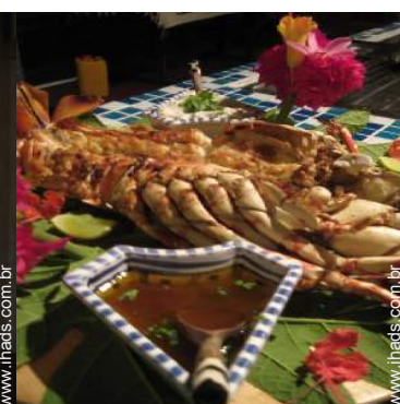
preparação refeição local