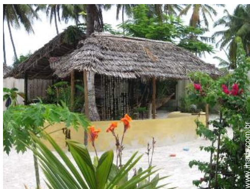
barbecue a gás