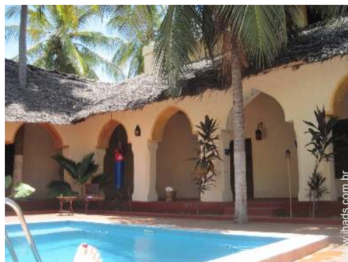
Aldeamento de qualidade