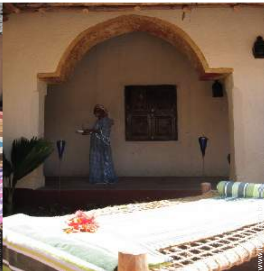
Aldeamento de qualidade