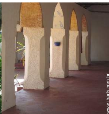
Aldeamento de qualidade