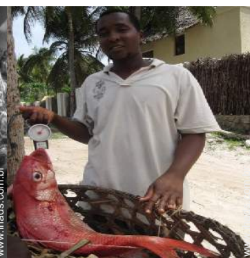
preparação refeição local