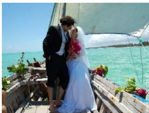
excursão de barco