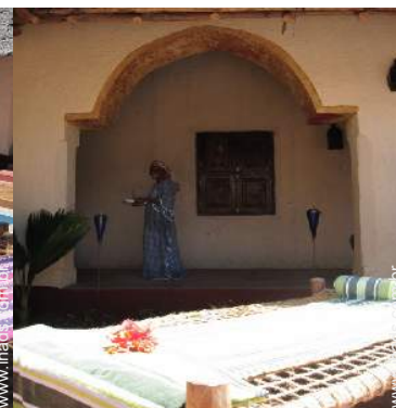
Aldeamento de qualidade