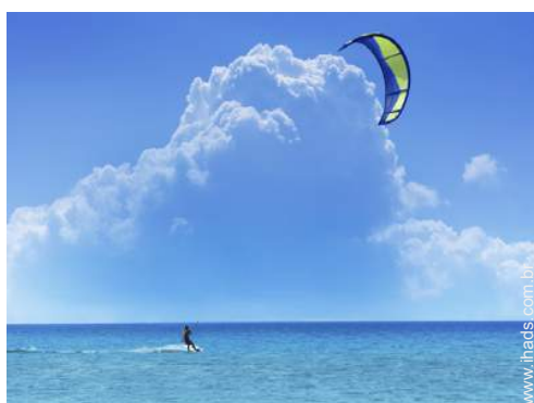
Equipamentos de lazer