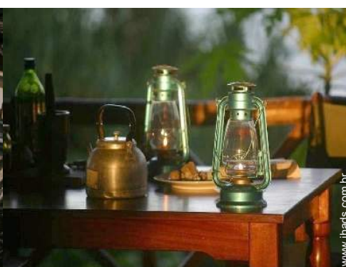
Conforto interior e equipamentos