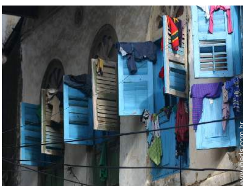
Cidades nas proximidades