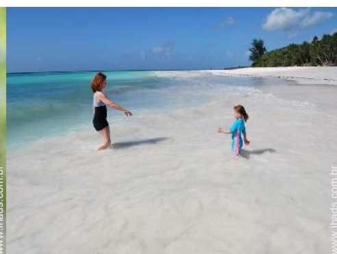
acesso directo à praia