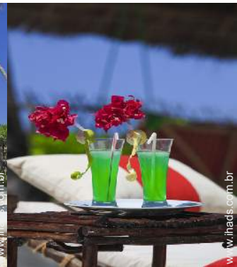
cadeira(s) de jardim