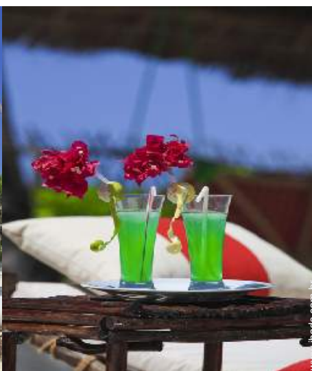
cadeira(s) de jardim