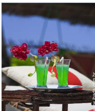
cadeira(s) de jardim