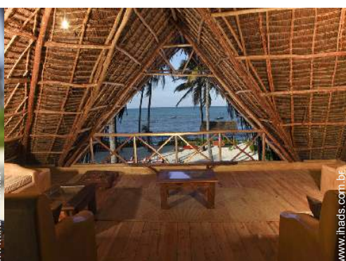
vista a partir do terraço sobre telhado