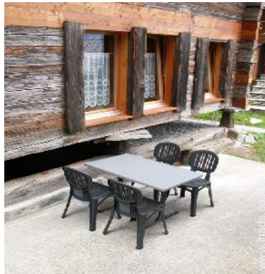
cadeira(s) de jardim