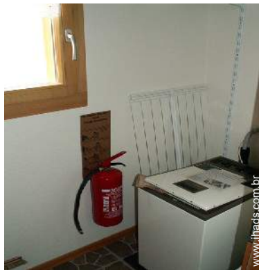
máquina de lavar roupa