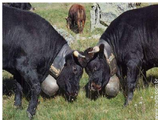
Atracções e lazer