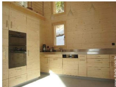
grande cozinha americana