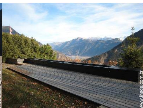
parque e jardim