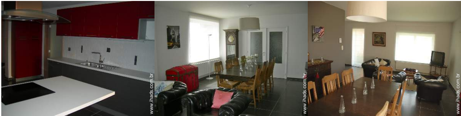
grande cozinha independente