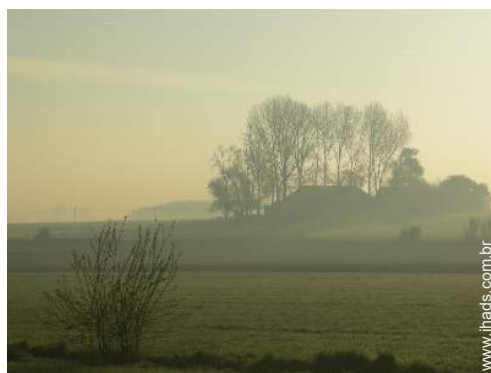
vista de campo