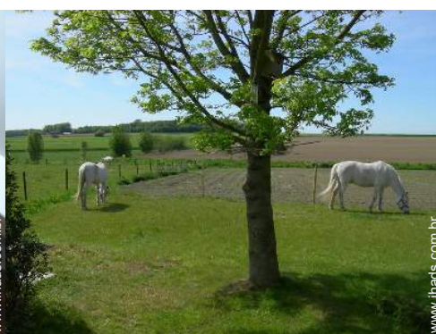
Os animais da casa