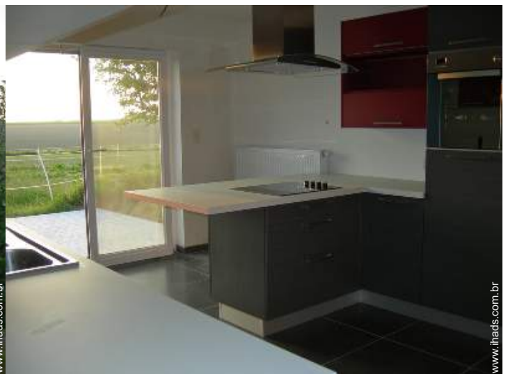
grande cozinha independente