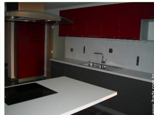
grande cozinha independente