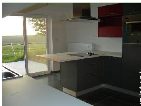
grande cozinha independente