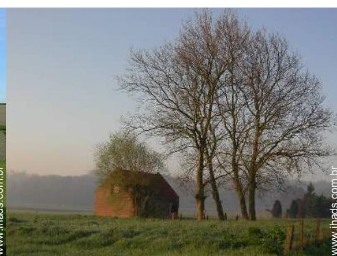
vista de campo