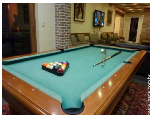
mesa de bilhar