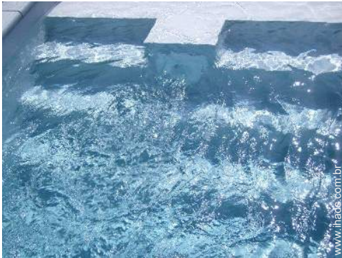
sistema para nadar em contra corrente