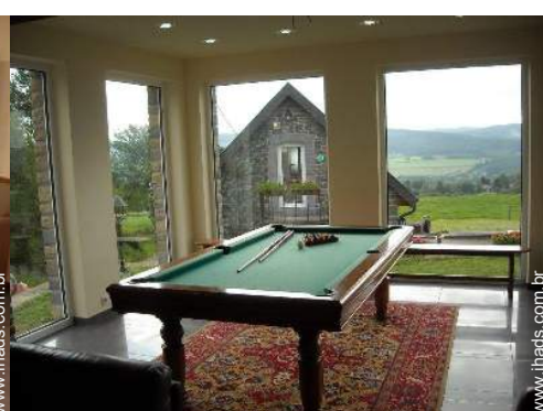
mesa de bilhar