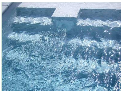
sistema para nadar em contra corrente