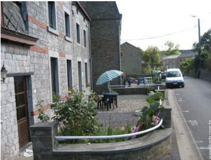
Casa de pedra