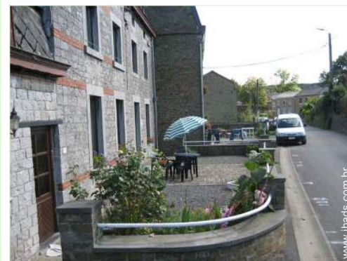
Casa de pedra