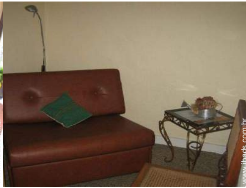
cama(s) de fechar individual