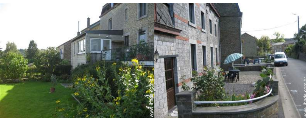
Casa de pedra