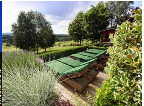
cadeira(s) de praia