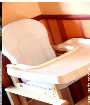
cadeira de bebé