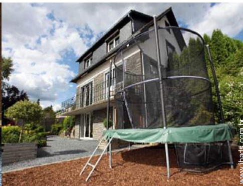
terreno de petanca