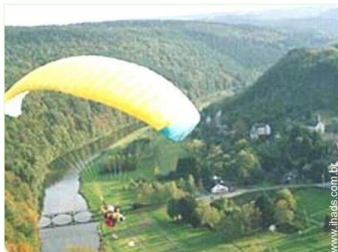
actividades aéreas nas proximidades