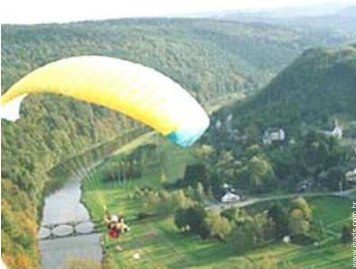
atividades aéreas nas proximidades