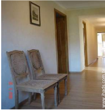
vista a partir da mezzanine