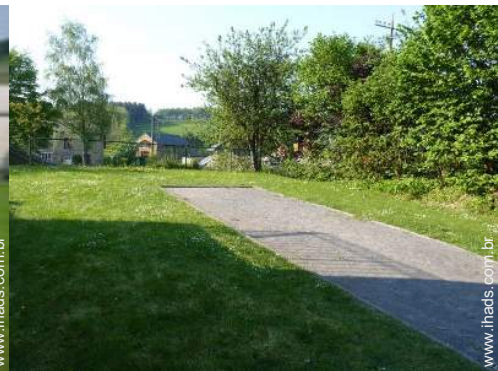
jogos de petanca