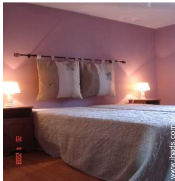
quarto do proprietário