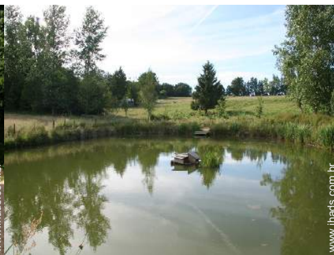
lago de jardim