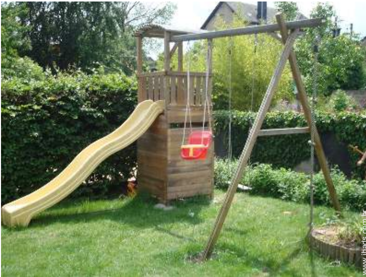
baloço para criança