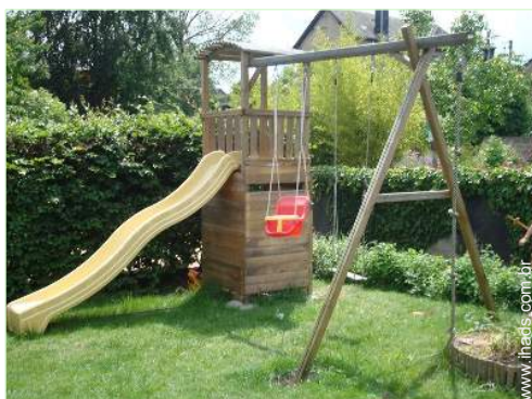
baloço para criança