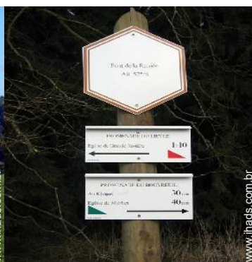
caminho de passeio