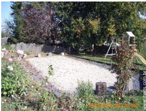
terreno de petanca